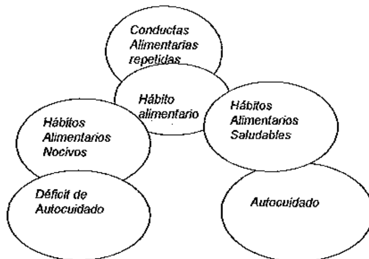
Gráfico 1 Conductas – Hábitos y Autocuidado.